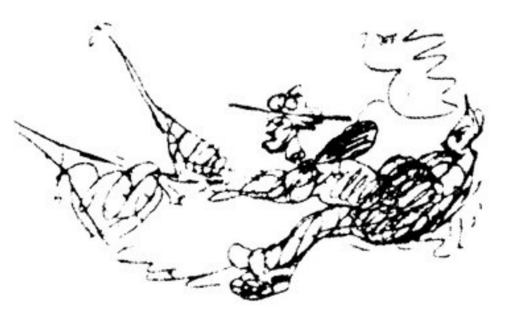
Рисунок В. МАЯКОВСКОГО из серии «ЖИРАФОВ» (1913 г. Из альбома В. Ф. ШЕХТЕЛЯ).