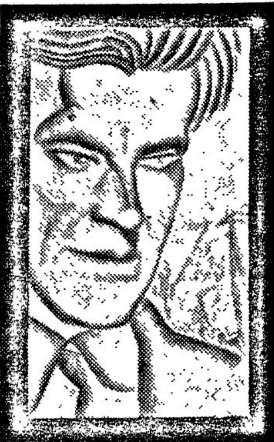
Неизвестный в СССР портрет В. МАЯКОВСКОГО работы худ. ИАРЕНО...